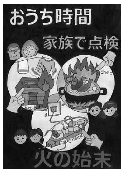
美方郡広域事務組合消防長表彰最優秀賞