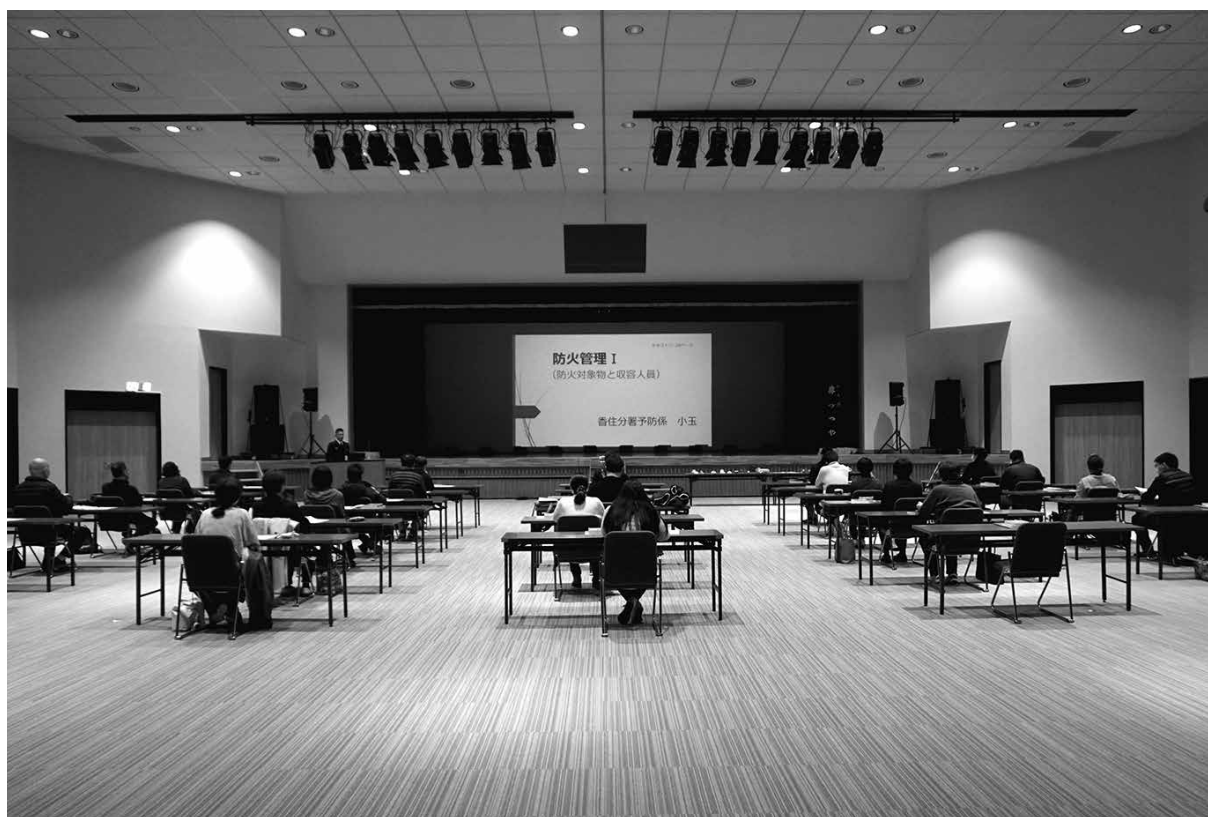
甲種防火管理新規講習

また、消防法令の違反是正のため関係機関との連携を図るなど、より一層の防火安全に努めるとともに、法令改正等の周知については、より早く、よりの確な情報を共有する組織づくりを合わせて実施し、火災等災害に強い体制づくりに期するよう予防業務を推進しています。