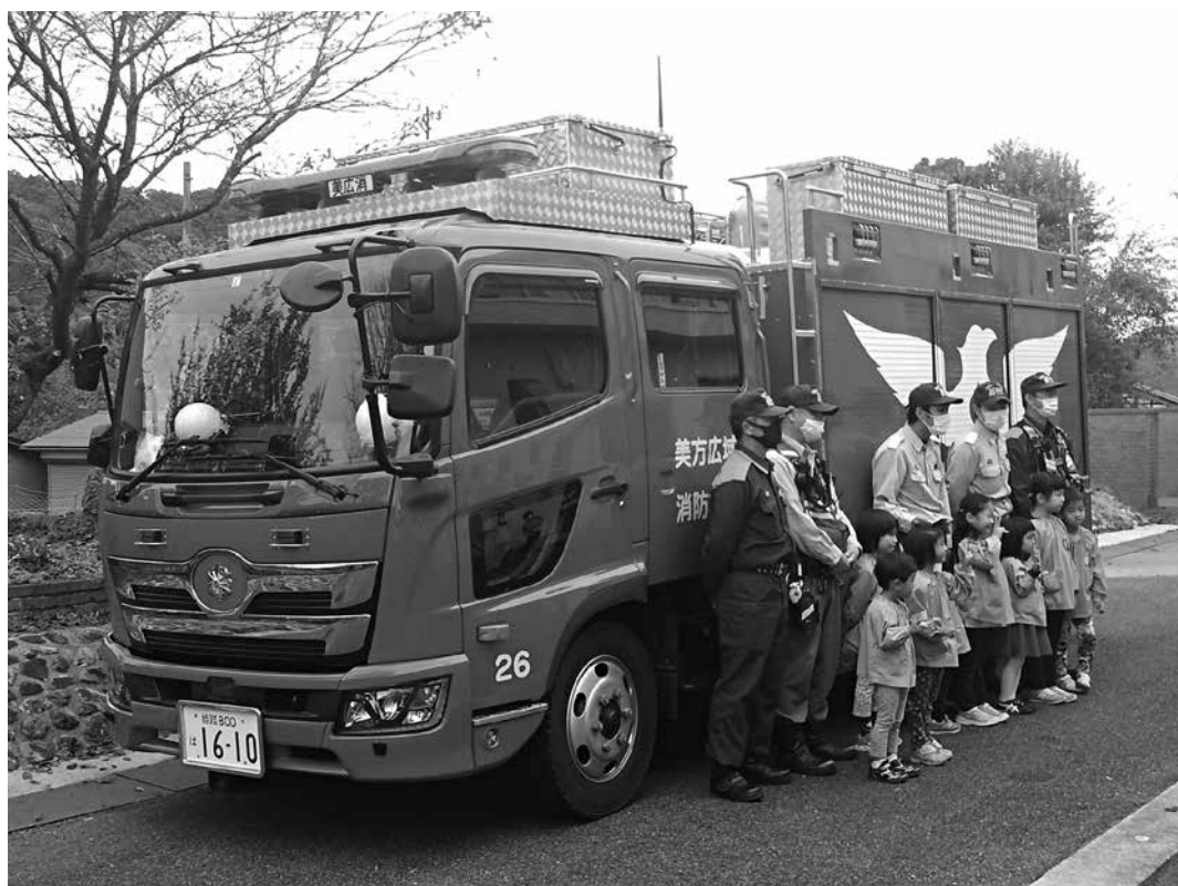
防火教室（香美町香住区）

※本年度も昨年度に引き続き、新型コロナウイルス感染拡大防止のため、行事を縮小又は中止しました。