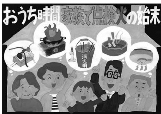
美方郡広域事務組合管理者表彰最優秀賞