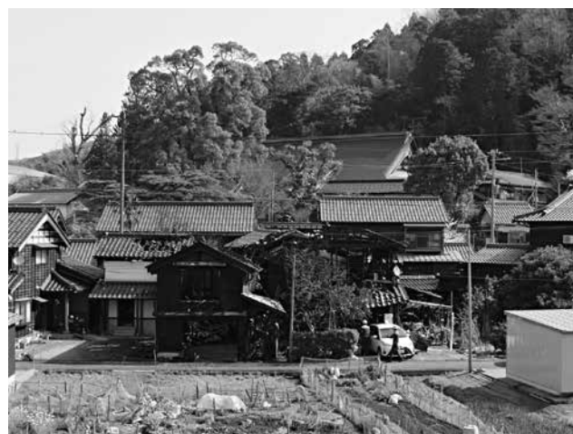
「香美町で発生した2件の建物火災」