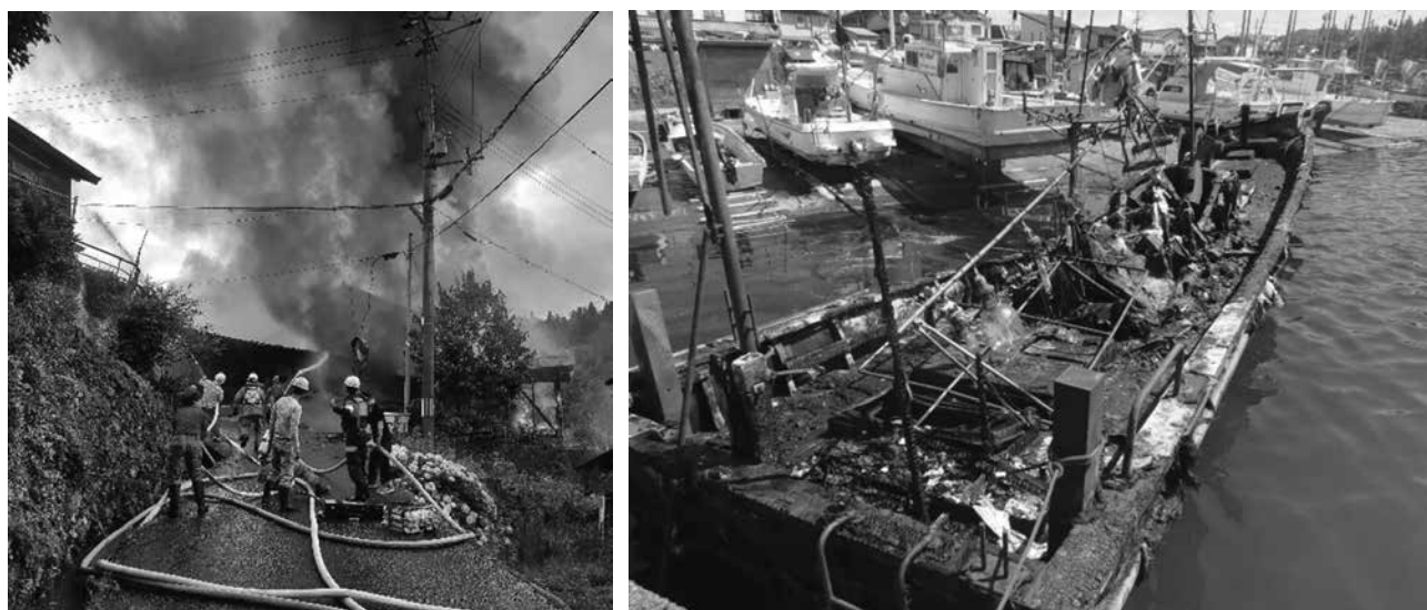
「香美町の建物火災と船舶火災」

特筆すべき火災としては、いずれも香美町で発生した4棟が焼損する建物火災と、7艘の漁船が焼損する船舶火災があげられます。