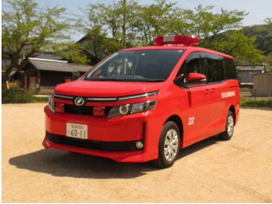
こうほうしゃ 広報車