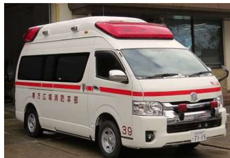
きゅうきゅうしゃ 救急車