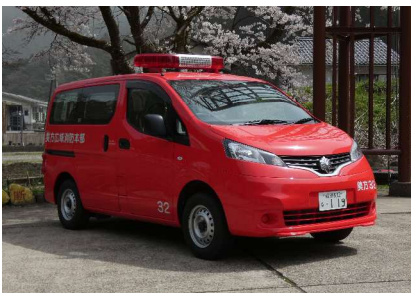
こうほうしゃ 広報車