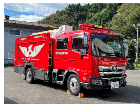
エムブイエフ MV F