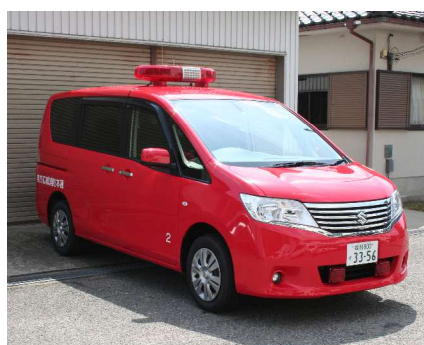
こうほうしや 広報車