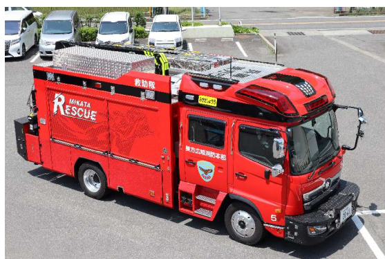
きゅうじょこうさくしや 救助工作車