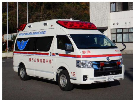
きゅうきゅうしや 救急車